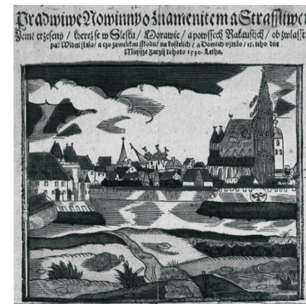
Erdbeben 1590 in Neulengbach: Schäden in Wien